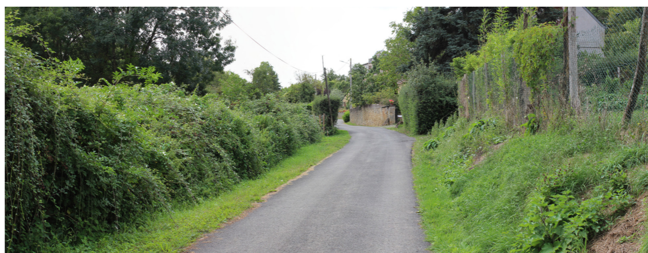
Photographie de l'état initial à 50°